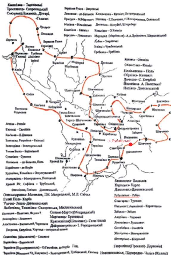
Схема подорожі Т. Г. Шевченка влітку 1843 року