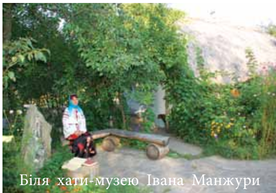
Біля хати-музею Івана Манжури

2012 - до 160-річного ювілею І. Манжури встановлено пам'ятний камінь поету;