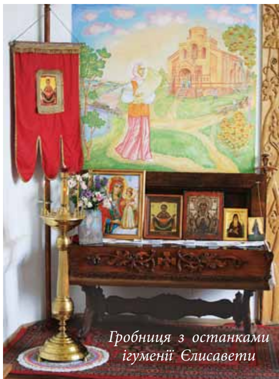
Гробниця з останками ігуменії Єлисавети

був дощенту зруйнований, багатьох монахинь замучили, а останки ігуменії Єлисавети викинули на смітник.