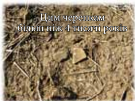
Цим черепкам більш ніж 4 тисячі років

Курган майже загинув у наслідок розорання сільськогосподарською технікою