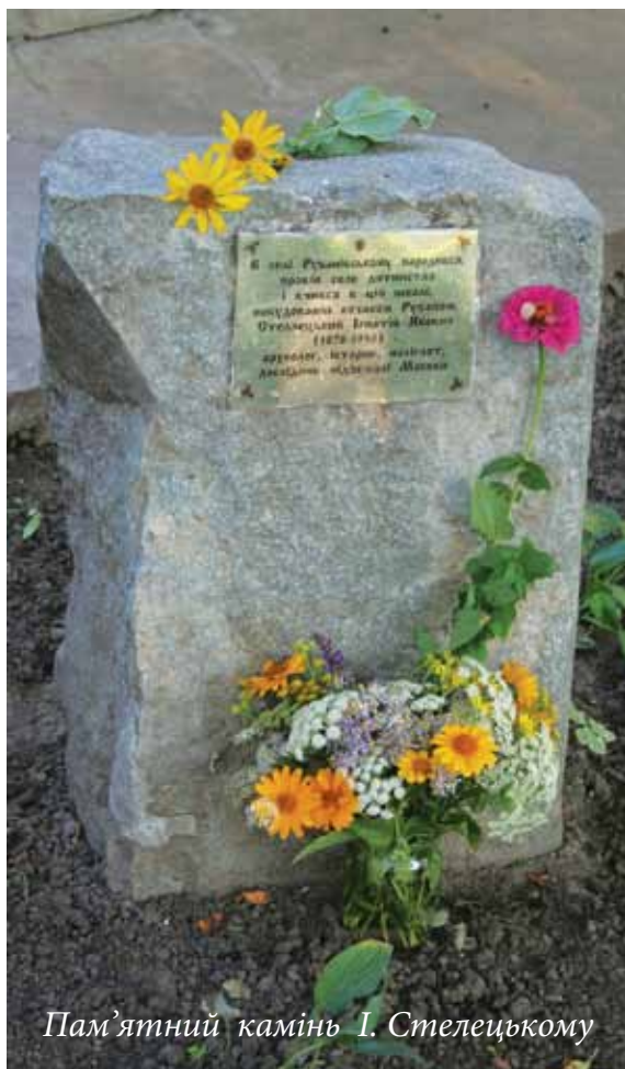
Пам'ятний камінь І. Стелецькому