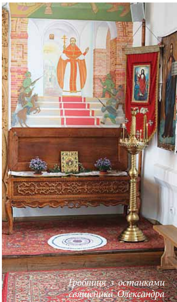
Гробниця з останками священника Олександра